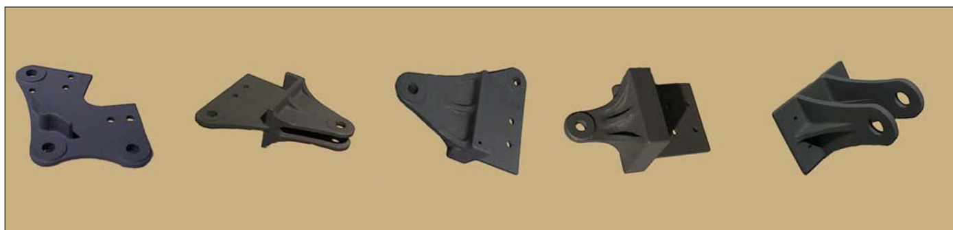
Bild 4: Die fünf Stahlgussknoten-Gussteile für die freitragende Dachkonstruktion aus G20Mn5N im Massebereich von 7 bis 23 kg