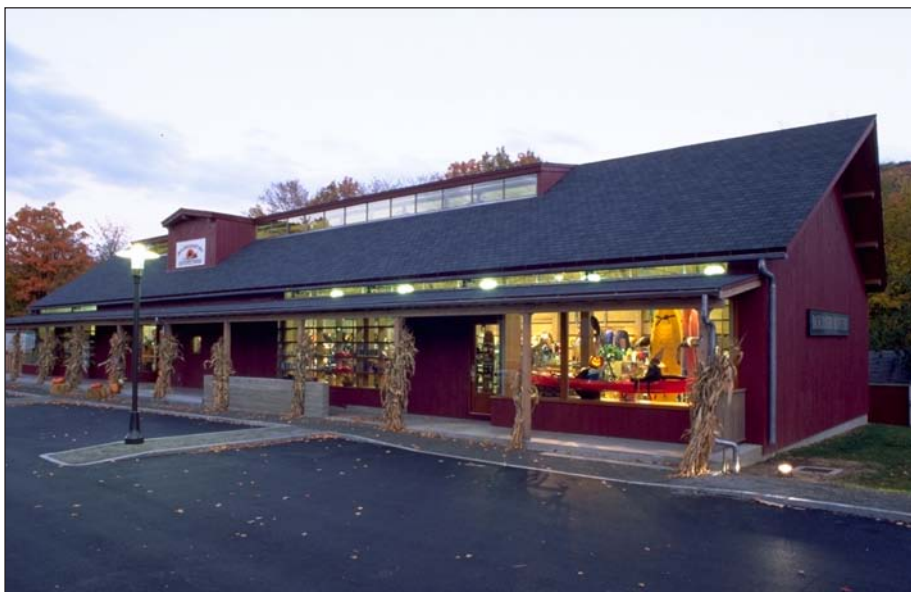
Bild 1: Das an die typische Holzhausbauweise angepasste neue Gebäude in Kent (Connecticut/USA)